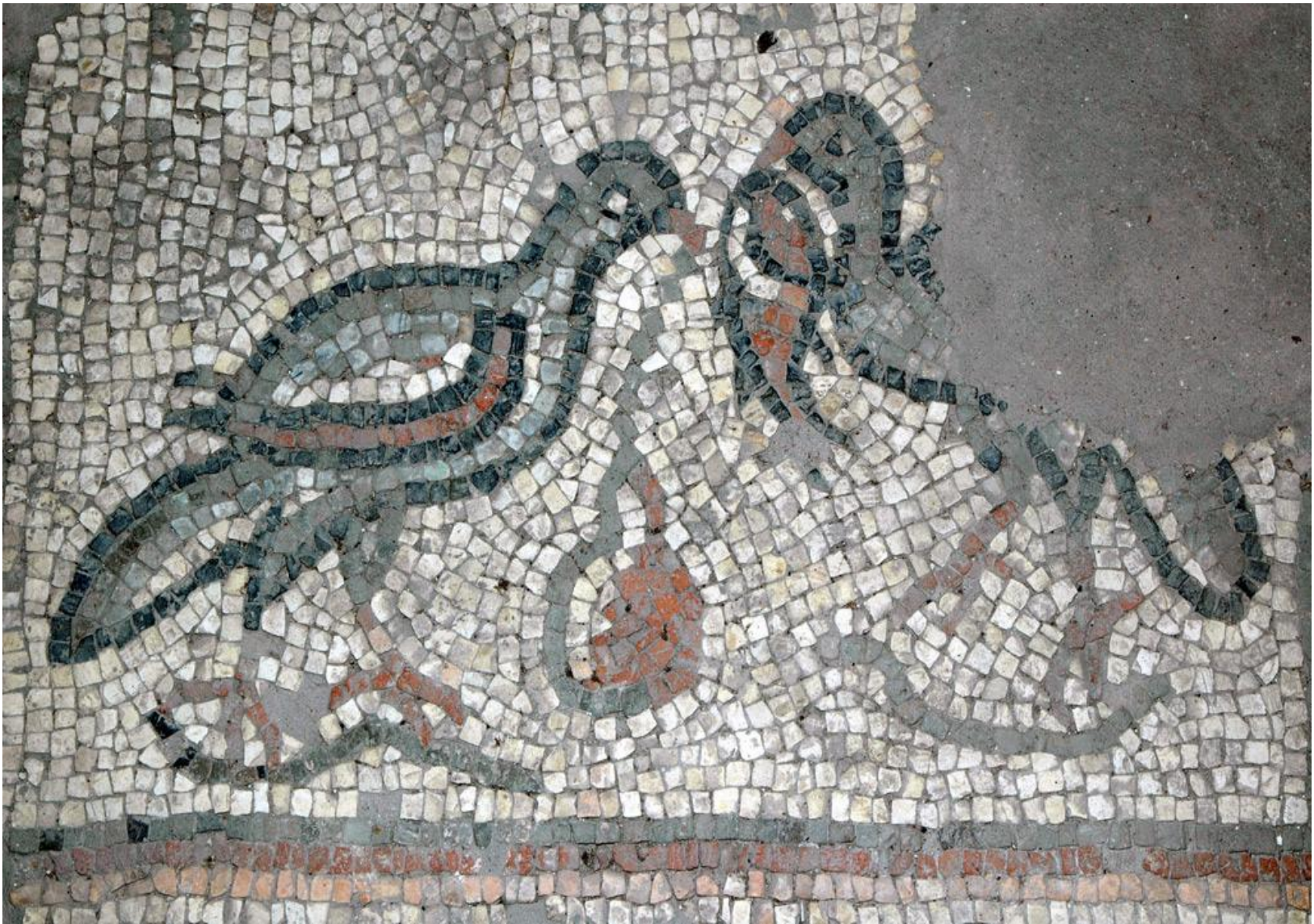
Santa Maria della Piazza (XI e XII secolo) Ancona