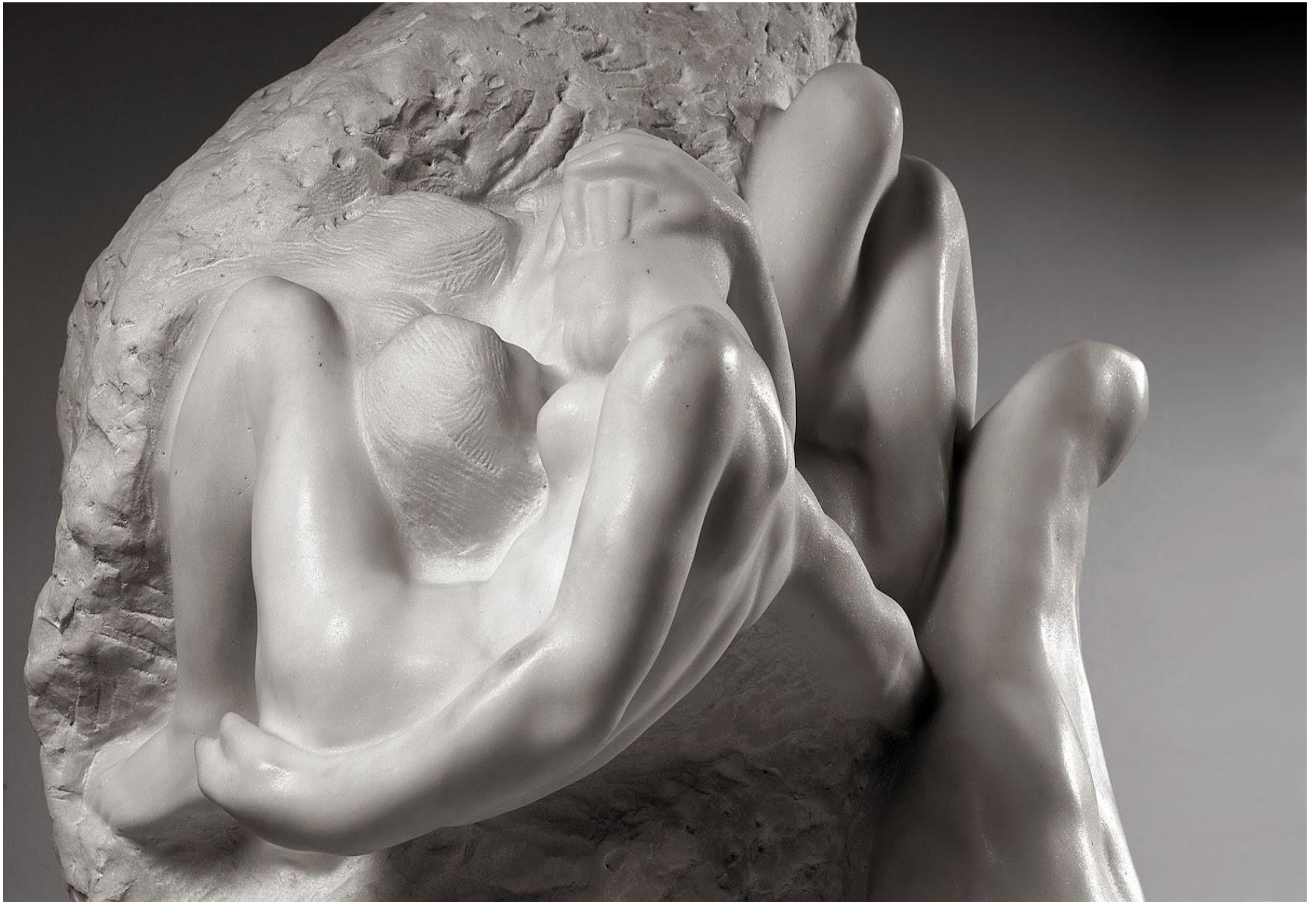
“La Mano Di Dio”, Rodin 1898 ca.