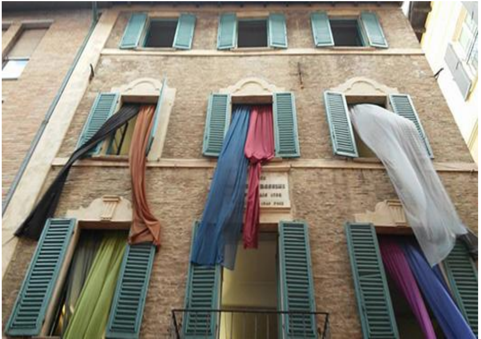
Casa natale di Rossini, Pesaro