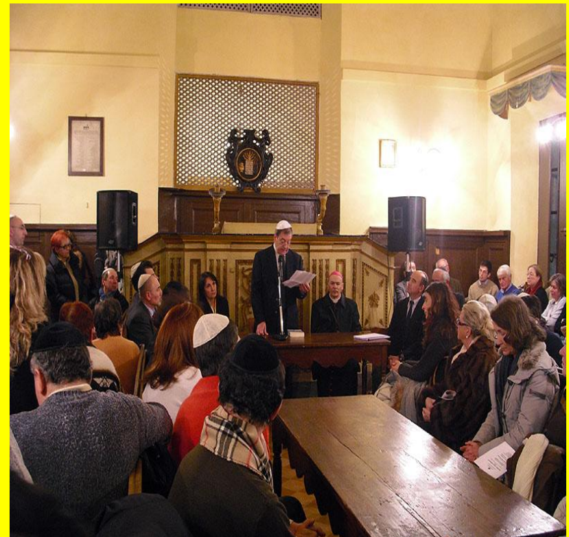
Sinagoga di Senigallia (interno)