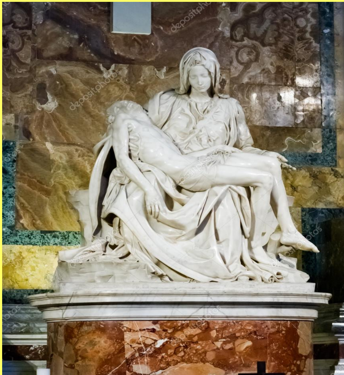
“La Pietà” ,Michelangelo Buonarroti 1497-1499