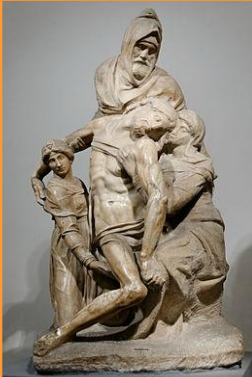
Pietà "Bandini" di Michelangelo 1547-1555