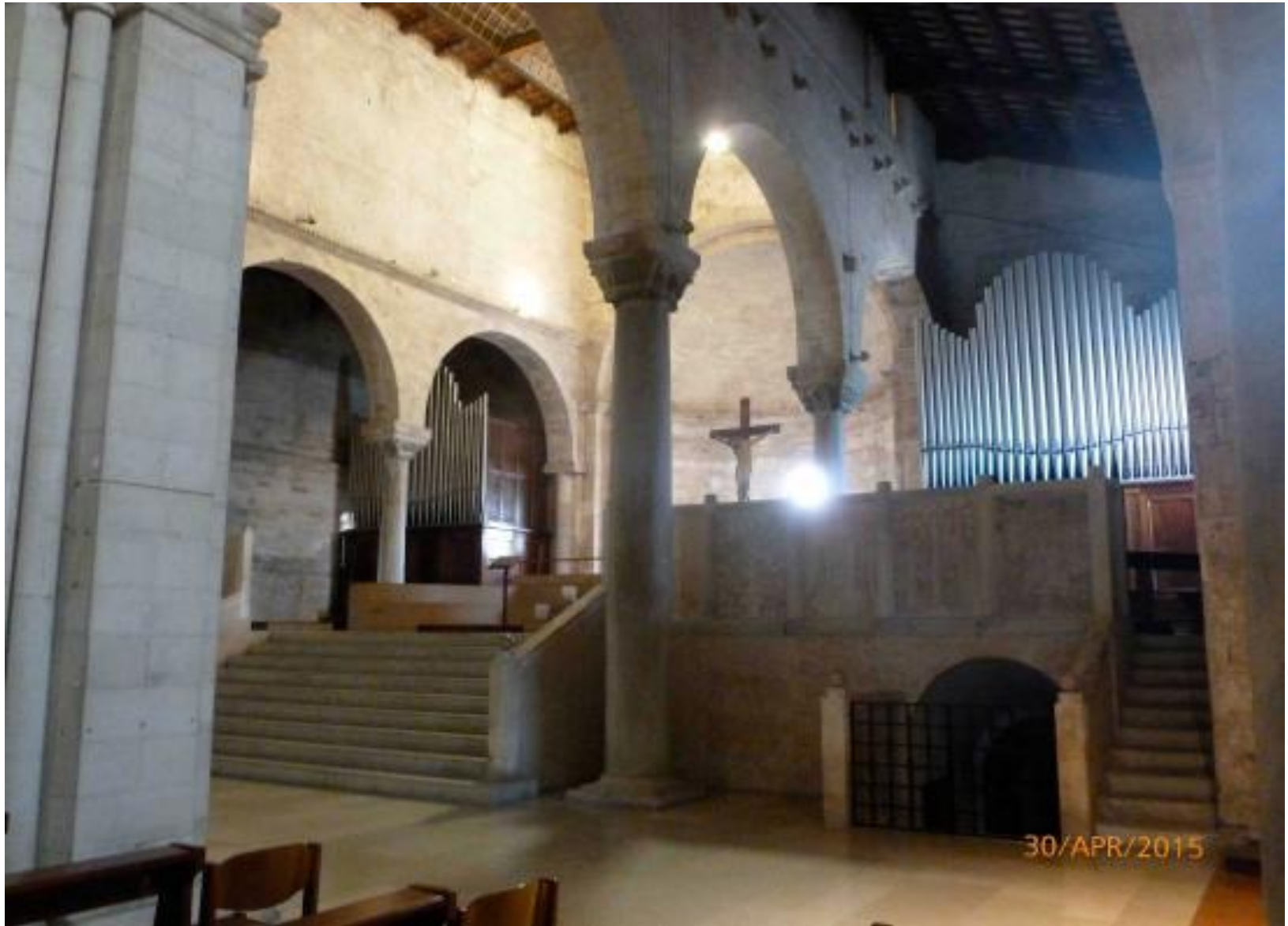
Duomo di San Ciriaco (IX-XII sec.) Ancona