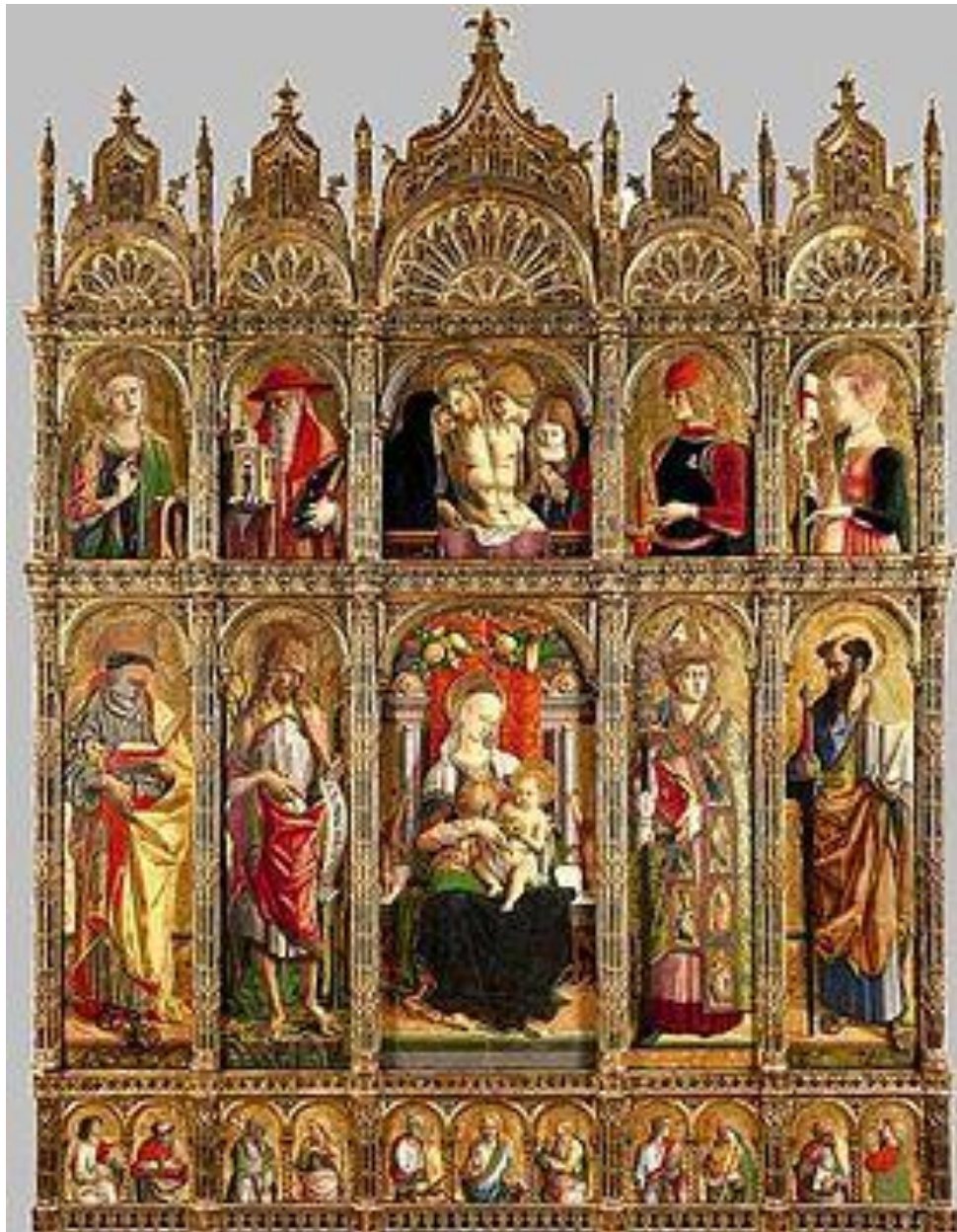
Polittico di Sant'Emidio 1473 Carlo Crivelli, Duomo di Ascoli Piceno