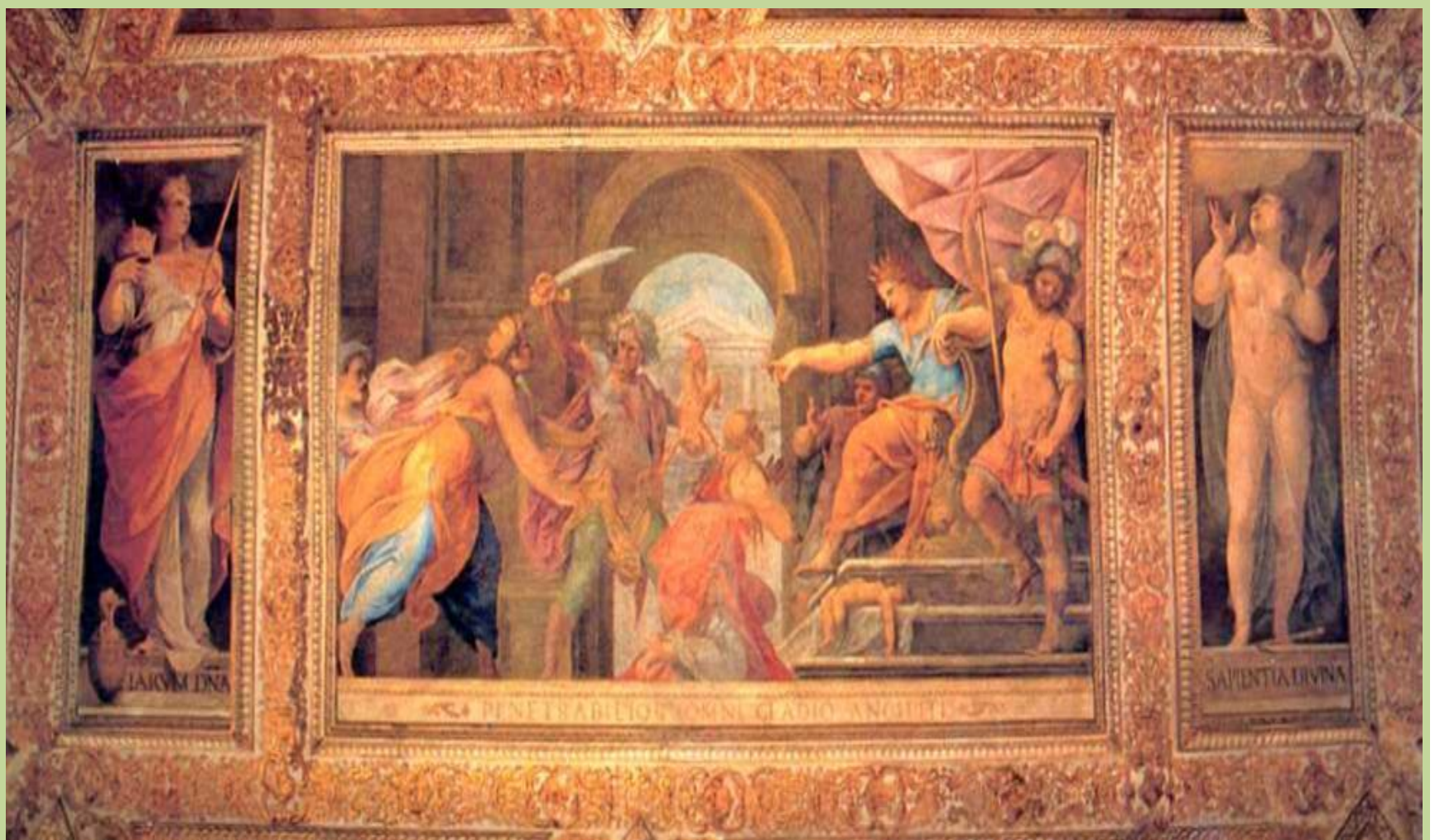
Giudizio di Salomone, Pomarancio (1605 – 1615) Palazzo Gallo (Unicredit) Osimo