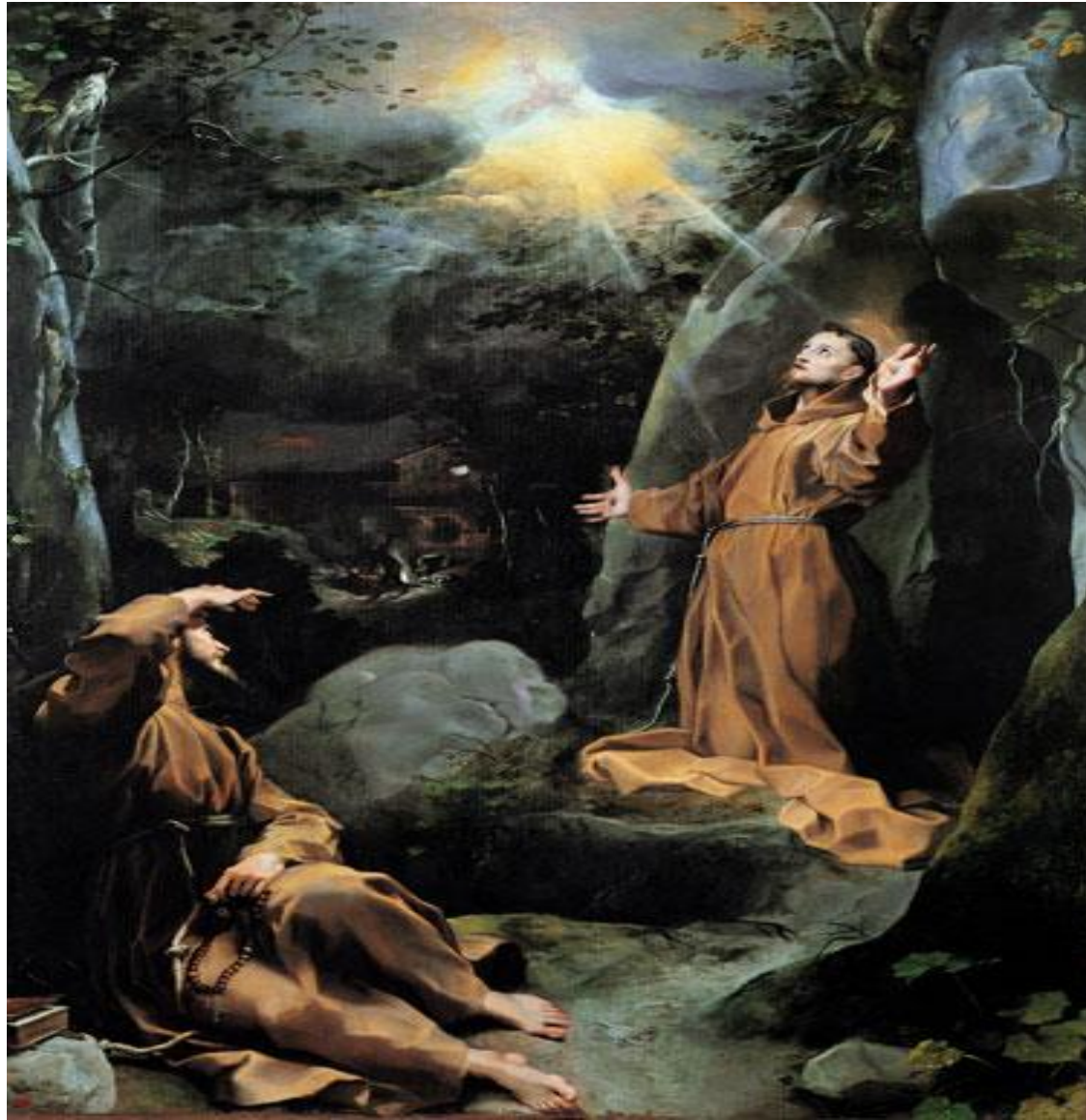
Federico Barocci – San Francesco che riceve le stimmate (1594-95)