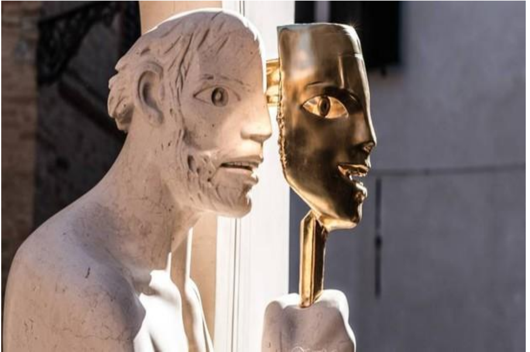
“Sculptura della memoria”(particolare) 2018 Giuliano Vangi, Pesaro